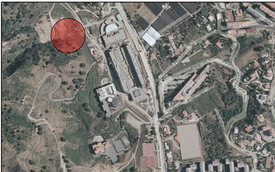
Immagine aerea Cittadella Universitaria in località Annunziata

L'area di progetto è situata all'interno della cittadella universitaria sita in località SS. Annunziata ed è identificata catastalmente nel N.C.T. al foglio 76, particella 611.