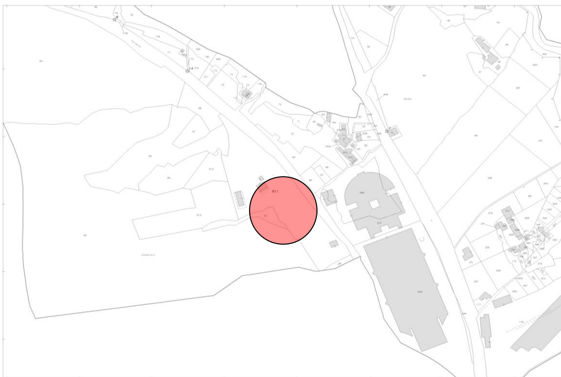
Stralcio catastale – foglio n. 76 part.611

L'area ricade, secondo il vigente P.R.G., in zona territoriale omogenea avente destinazione urbanistica "E1", regolamentata dall'art. 49 delle Norme Tecniche di Attuazione.