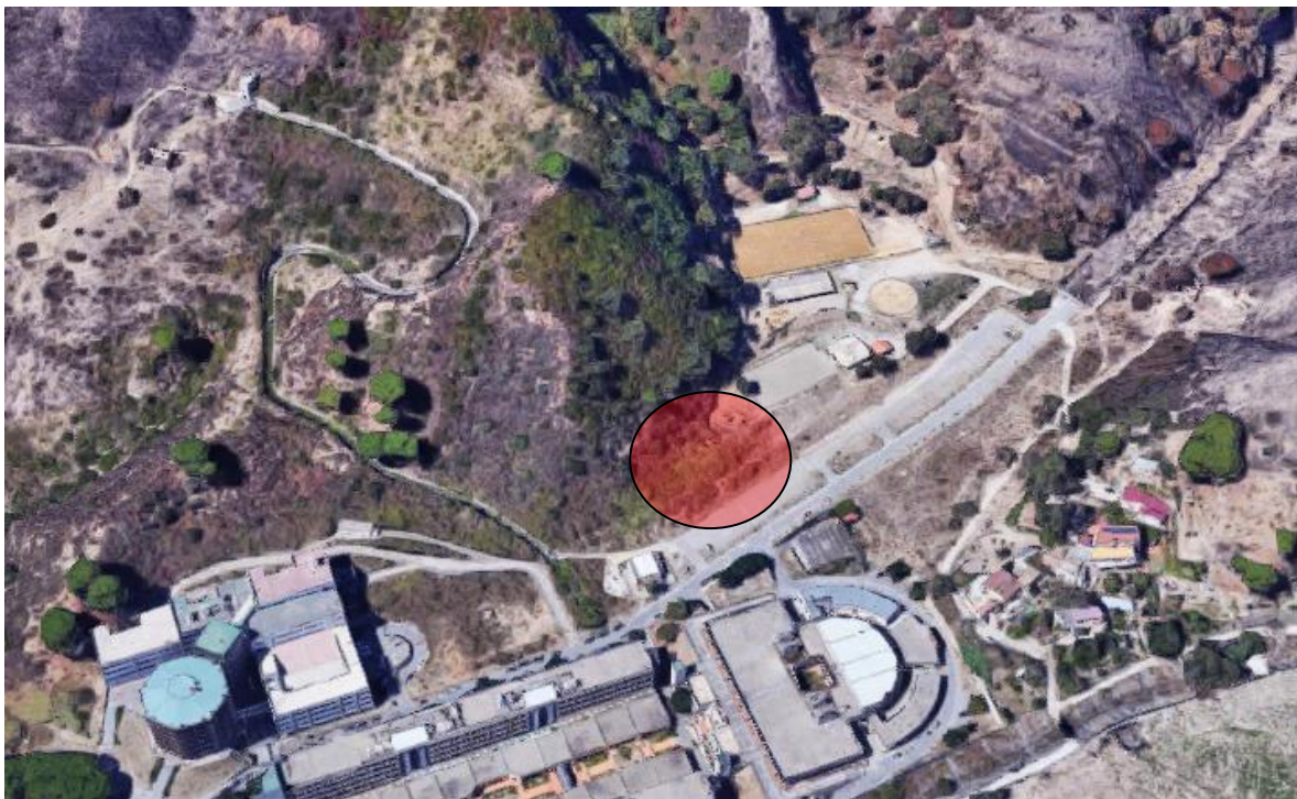
Immagine aerea con individuazione area d'intervento

L'assetto morfometrico dell'area, è strettamente legato alla natura litologica dei terreni affioranti, oltre che all'azione modellatrice degli agenti esogeni, segnatamente le acque incanalate, le quali incidono più o meno profondamente la superficie topografica, esercitando un'intensa erosione di fondo. L'area in oggetto che attualmente versa in stato di abbandono, appare incolta. Tale superficie risulta ubicata nei pressi di un lotto di terreno sistemato, come sopra detto, (Autorizzazione Paesaggistica rilasciata dalla Soprintendenza BB.CC.AA. prot. n. 1461/06 del 24/05/2006) allo scopo di realizzare un maneggio per cavalli, funzionale alla Pet Therapy svolta dalla Facoltà di Medicina.